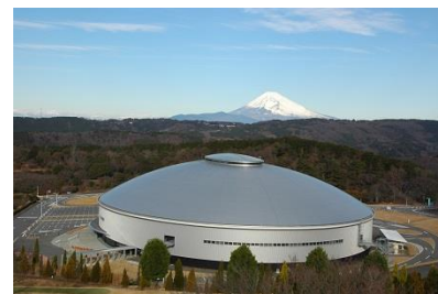
伊豆ベロドローム外観

「伊豆ベロドローム」は、国際自転車競技連合（uci）規格の周長250m走路を有する国内初の屋内型自転車トラック競技施設です。トラックコースは、幅員7.5m、最大傾斜角度45°、表面にはシベリア松を使用した木製張り。2011年の開業以来、全日本選手権自転車競技大会トラック・レースなど多くの国内主要大会の他、毎年、国際大会でも使用されています。